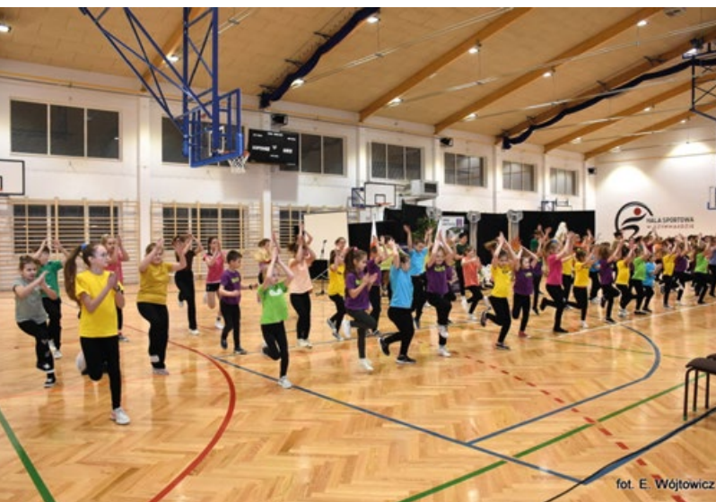
fol. E. Wójtowicz

Dziękujemy wszystkim, którzy w jakikolwiek sposób wsparli niniejszą inwestycję. Nowoczesny obiekt będzie służył wszystkim mieszkańcom i umożliwi m.in. prowadzenie zajęć z wychowania fizycznego, organizowanie wydarzeń sportowych jak i kulturalnych.